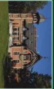
Pałac Dębowy w Karpnikach