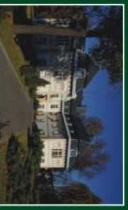
Pałac w Miłkowie