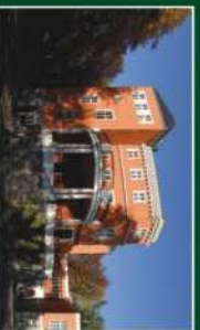
Pałac Paulinum w Jeleniej Górze