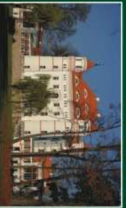
Pałac w Wojanowie