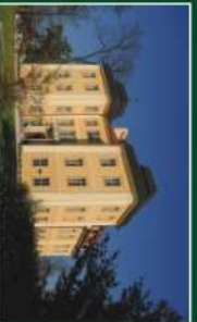
Pałac w Łomnicy