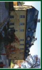
Pałac w Stanisławowie